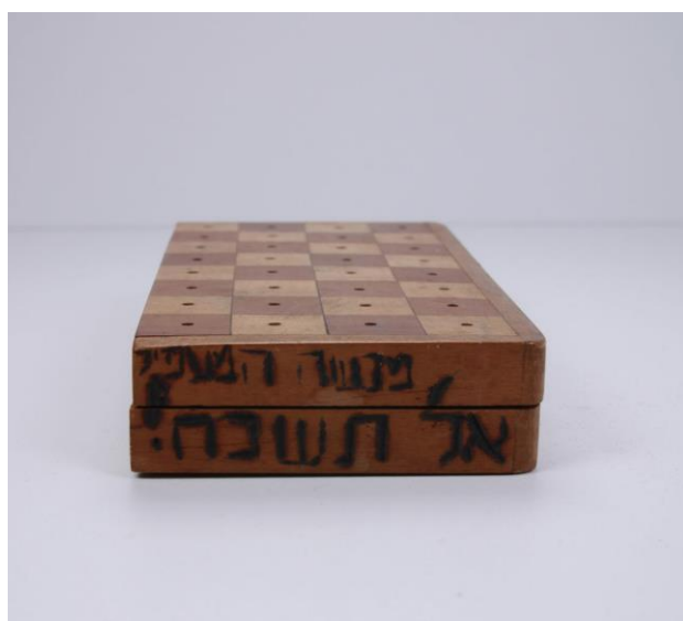
לוח שחמט, מזכרת ממעפילי אקסודוס.