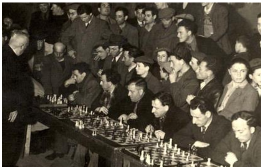
סימולטני בשחמט במחנה העקורים וצלאר (Wetzlar).