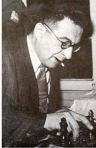
ד"ר מנחם אורן.

אלוף השחמט הראשון של מדינת ישראל ד"ר מנחם אורן (מנדל חבויניק 1902-1962) גם הוא ומשפחתו הגיעו למחנה העקורים במינכן ב-1946, עד לעלייתם ארצה ביולי 1949. ד"ר אורן היה מורה מעולה לפיזיקה ושחמטאי חזק בפולין. באולימפיאדת אמסטרדם 1928 הוא גם השתתף בנבחרת פולין.